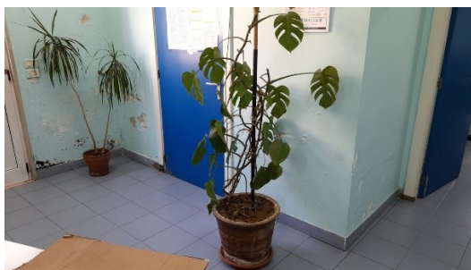
Stato di fatto locali Guardia Medica