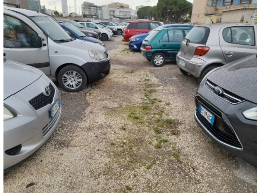
Stato attuale del manto stradale viabilità e parcheggio