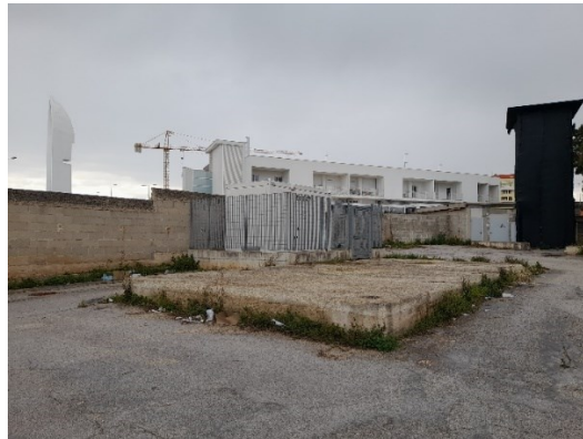
Possibile ubicazione nuova isola ecologica

Vi è la necessità di realizzare un'area esterna attrezzata da destinare ad isola ecologica per la raccolta dei rifiuti solidi urbani e dei rifiuti sanitari speciali. L'area dove collocare la nuova isola ecologica potrebbe essere individuata nell'attuale zona parcheggio. La spesa prevista ammonta a € 180.000,00 da finanziare con i fondi FESR 2021-2027.