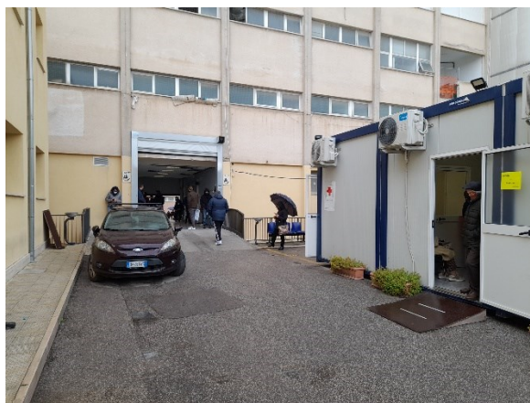
Utenza in attesa fuori dal PS del P.O.

Al fine di risolvere tale problematica, è stato previsto un ampliamento del Pronto Soccorso negli attigui locali adibiti a deposito della farmacia, che verrà spostato negli ambienti attualmente vuoti delle cucine. L'importo di tale intervento è stimato pari a circa € 900.000,00 da finanziare con i fondi FESR 2021-2027. Nelle more dell'esecuzione di tale intervento, sarà installata con fondi propri una tensostruttura che permetterà una migliore accoglienza.