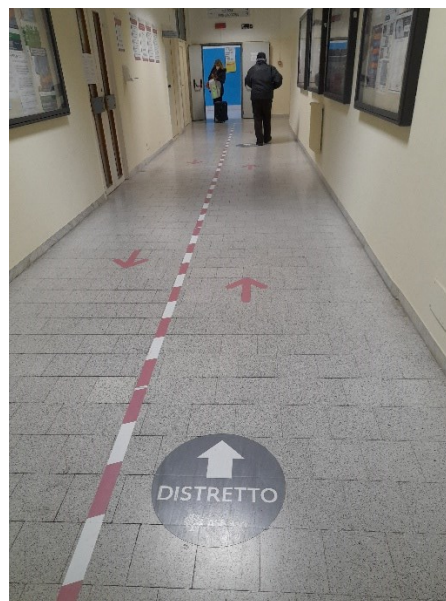
Attuale segnaletica di indicazione per i servizi del DSS1