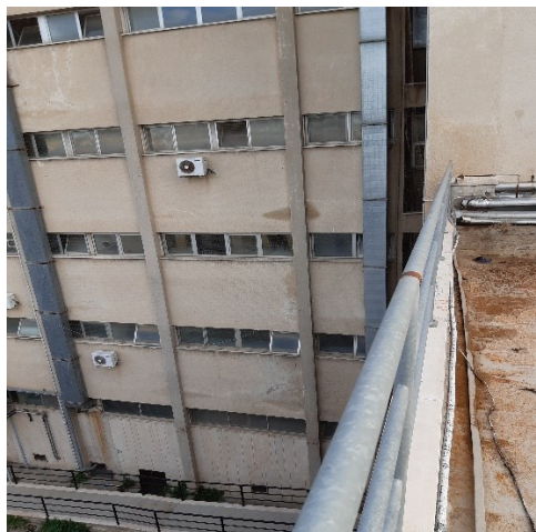
Infissi allo stato attuale