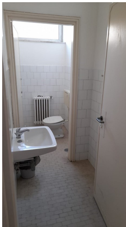
Stato di fatto Obitorio