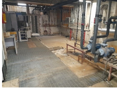
Stato di fatto centrale termica e sottocentrale