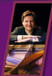
Christoph Soldan Pianoforte